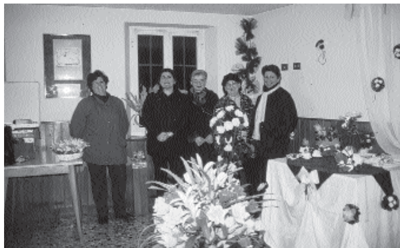
Alcune artiste con le composizioni floreali.