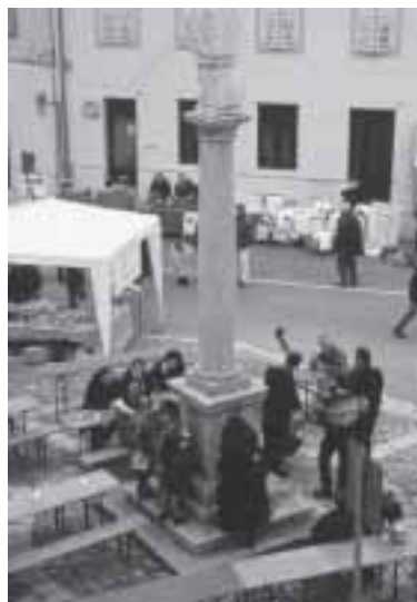
San 'Suan, barachis e sunadôrs.

stis di Nadâl, la kabossa cu la pifania a lis an siaradis; la kabossa che par furlan a ciapa mil nons, chist an a si la 'ndâ fata al sis di 'senar ancja se a fos tradision di impiâ al fuc ta vilia da pifania. Come di cualchi an in ca, prima da kabossa a si a fat la "Lucciolata", roba che ormai a je entrada cuasi di tradision e che riva a clamâ tanta int par judâ la "Casa di Natale2" di Avian (PN) e ancja se chista volta la int no era come che dai ains passâs bisugna di brâs a duc' chei ca son lâs sot da ploja par un mutif cusi impuartant.