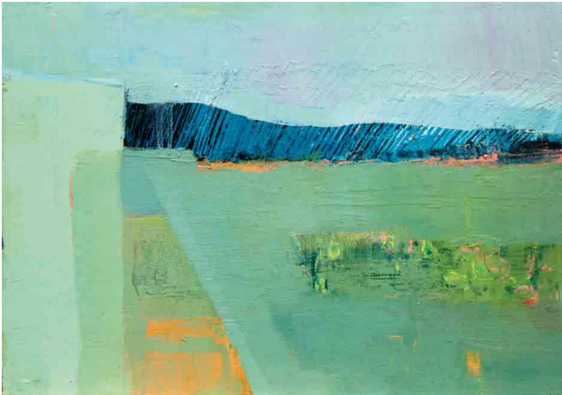
Uànis - Strada tal Sobresch