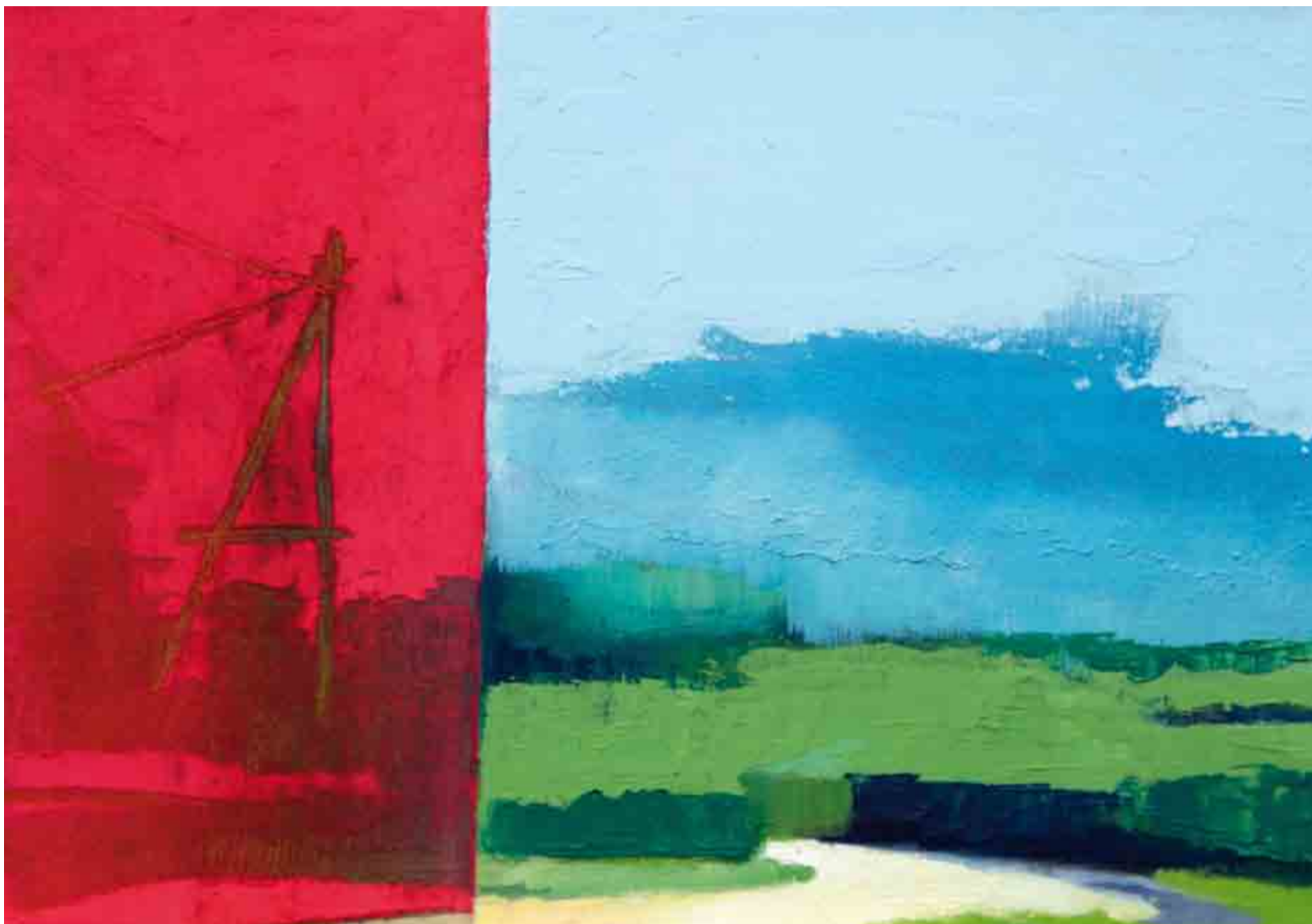
Via dai Ciamps Larcs