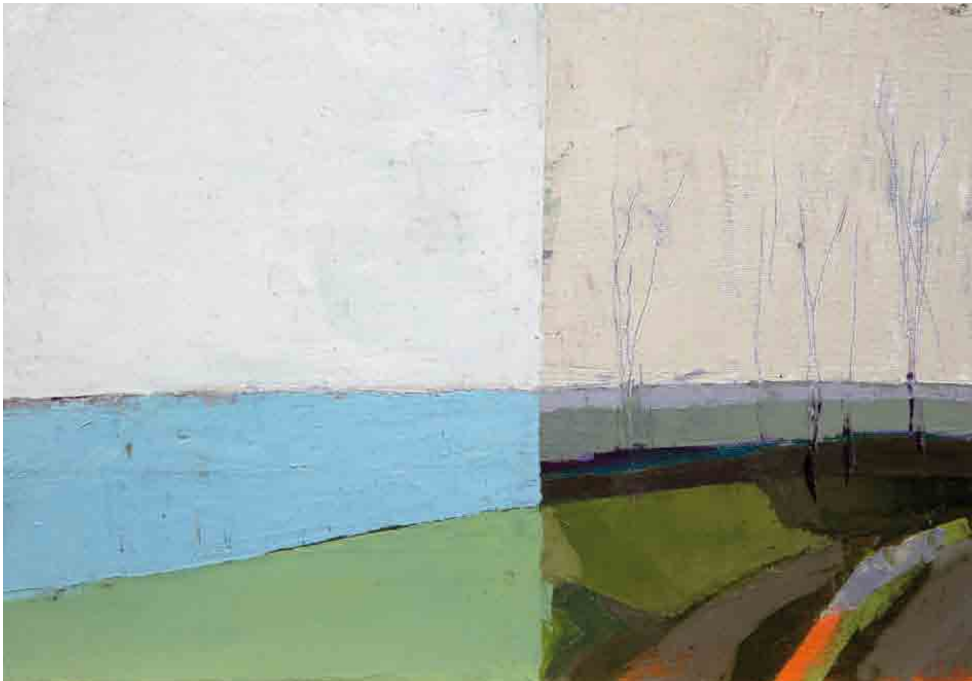
Strada su li Bris'cis