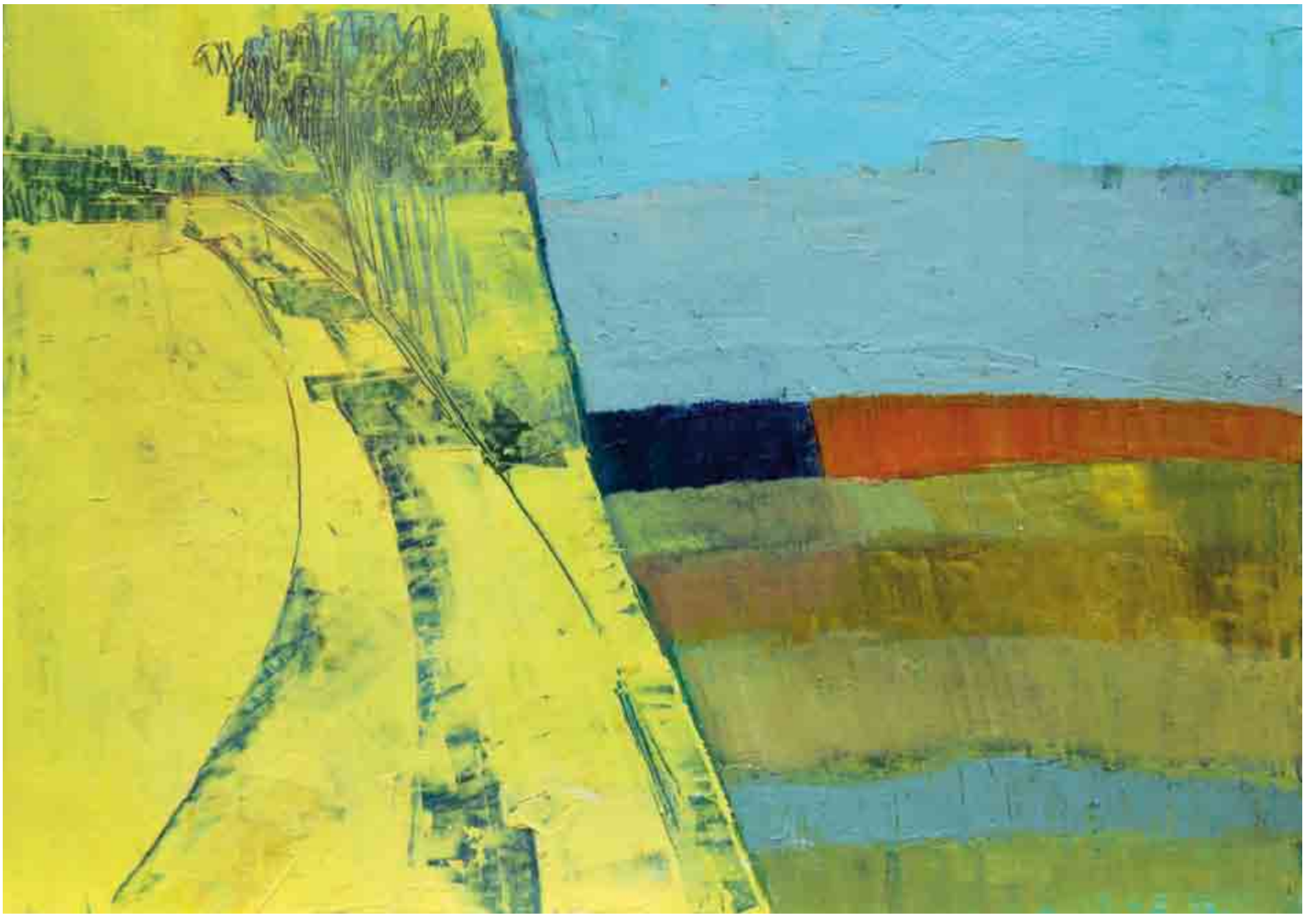
Uànis - Strada sui Pràs