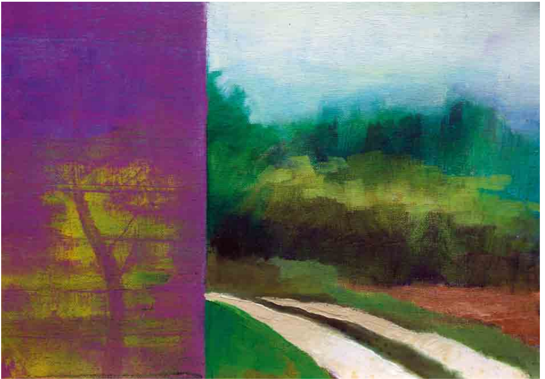
Via dal mulin di Miseu