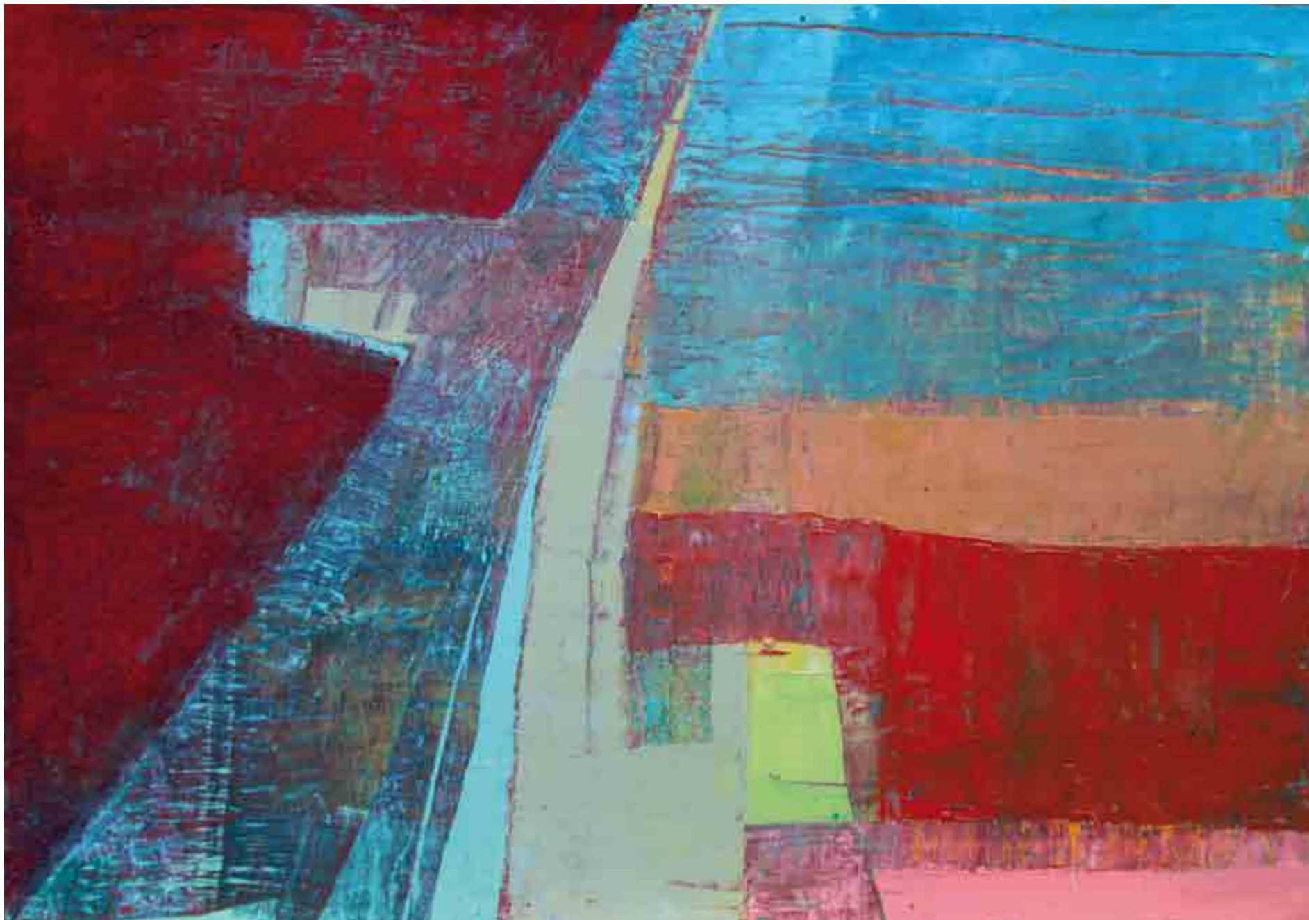
Strada da Streta banda li' Saldoneris