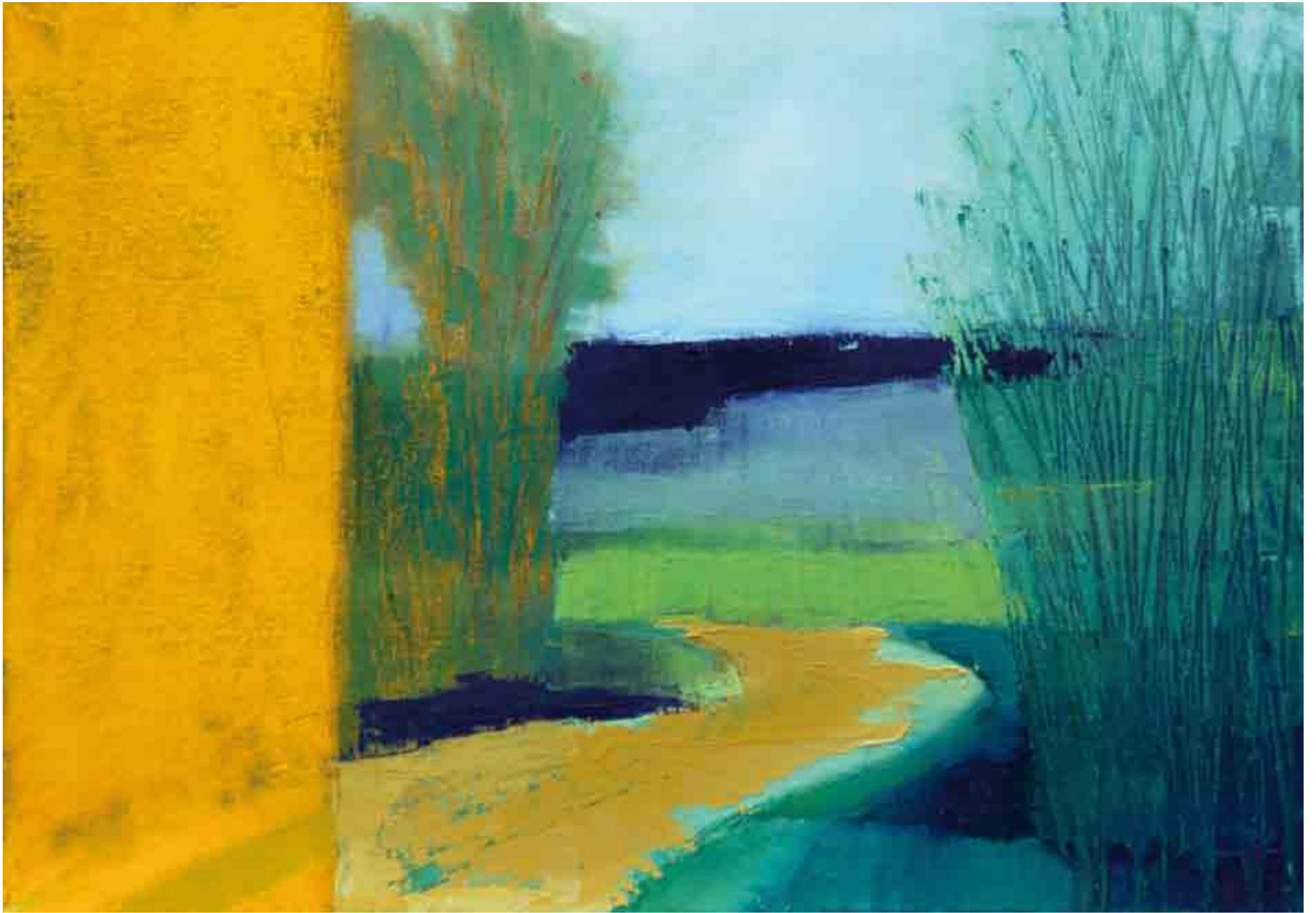
Strada pa Ciarandis