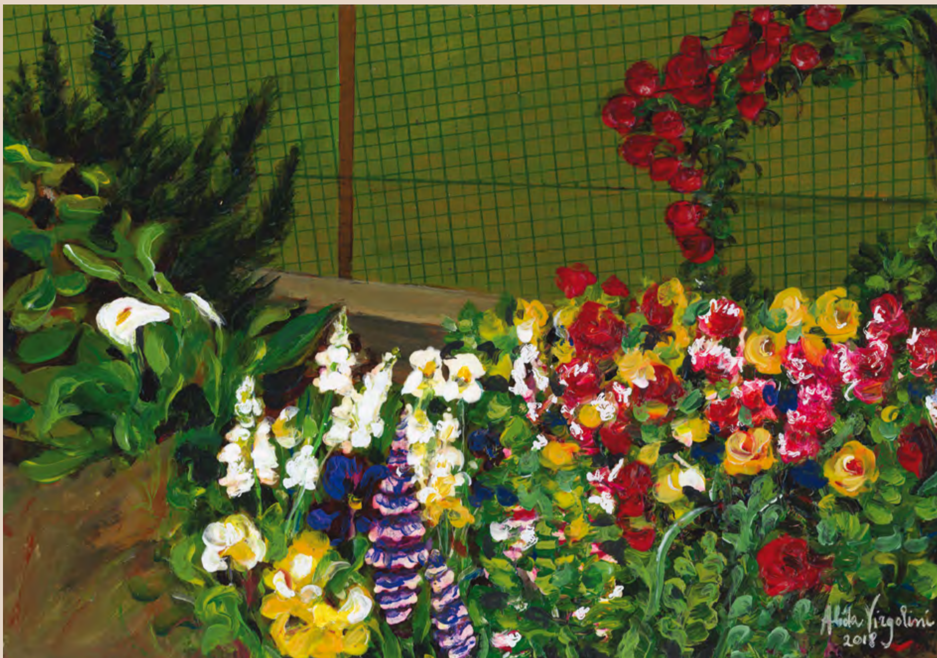
Rosis tal 'sardin da famea Baggio