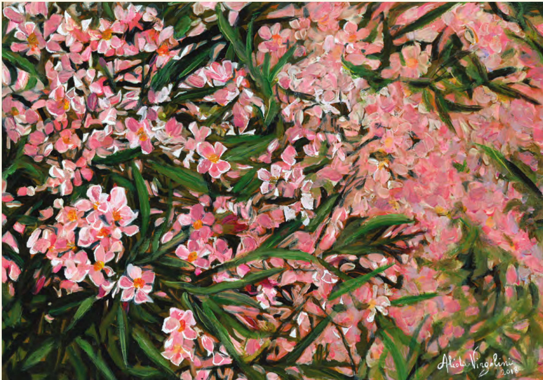
Viei oleandros ca di Grion banda Ciavensan