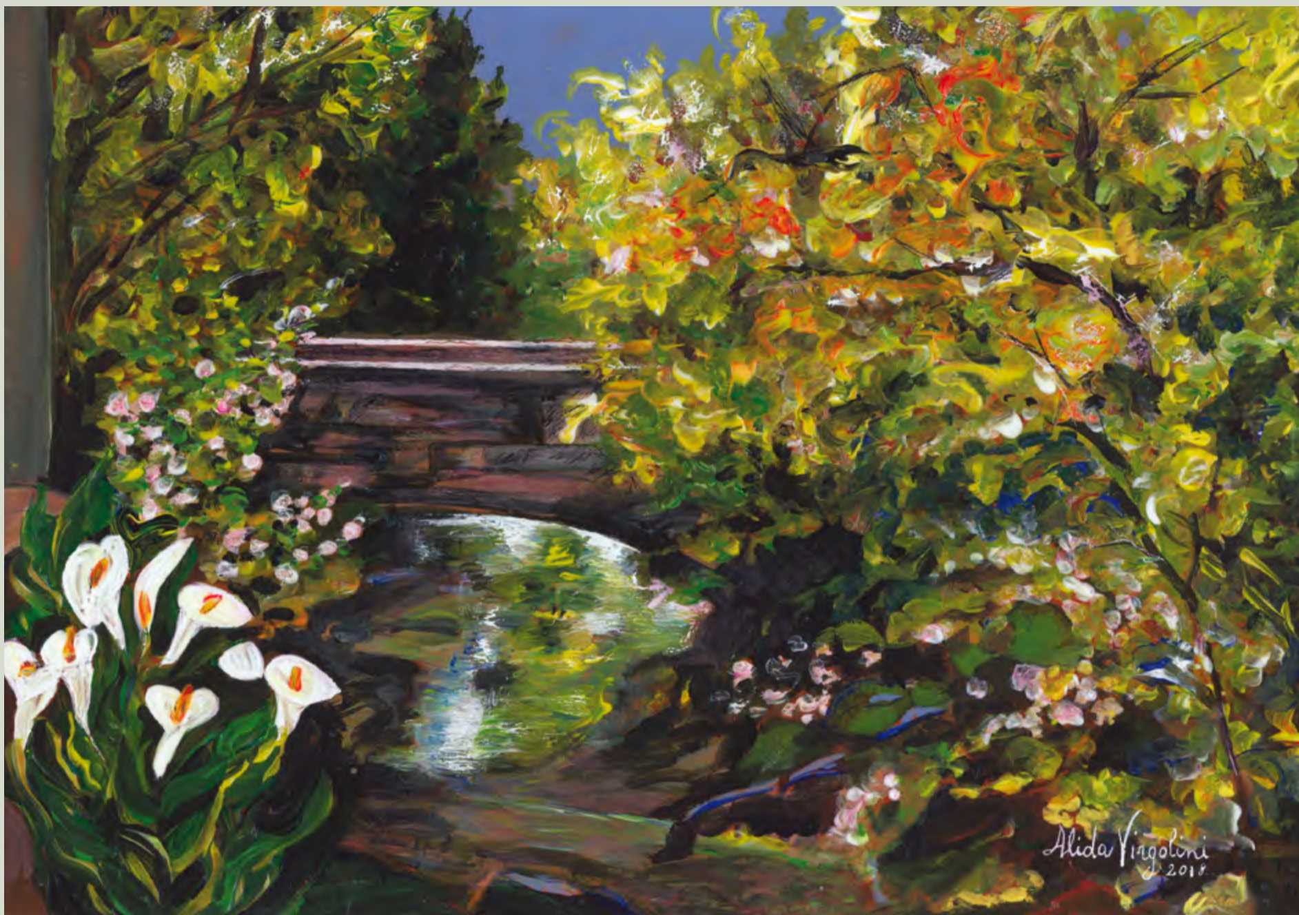
Calis dongia dal puint dal Nauac