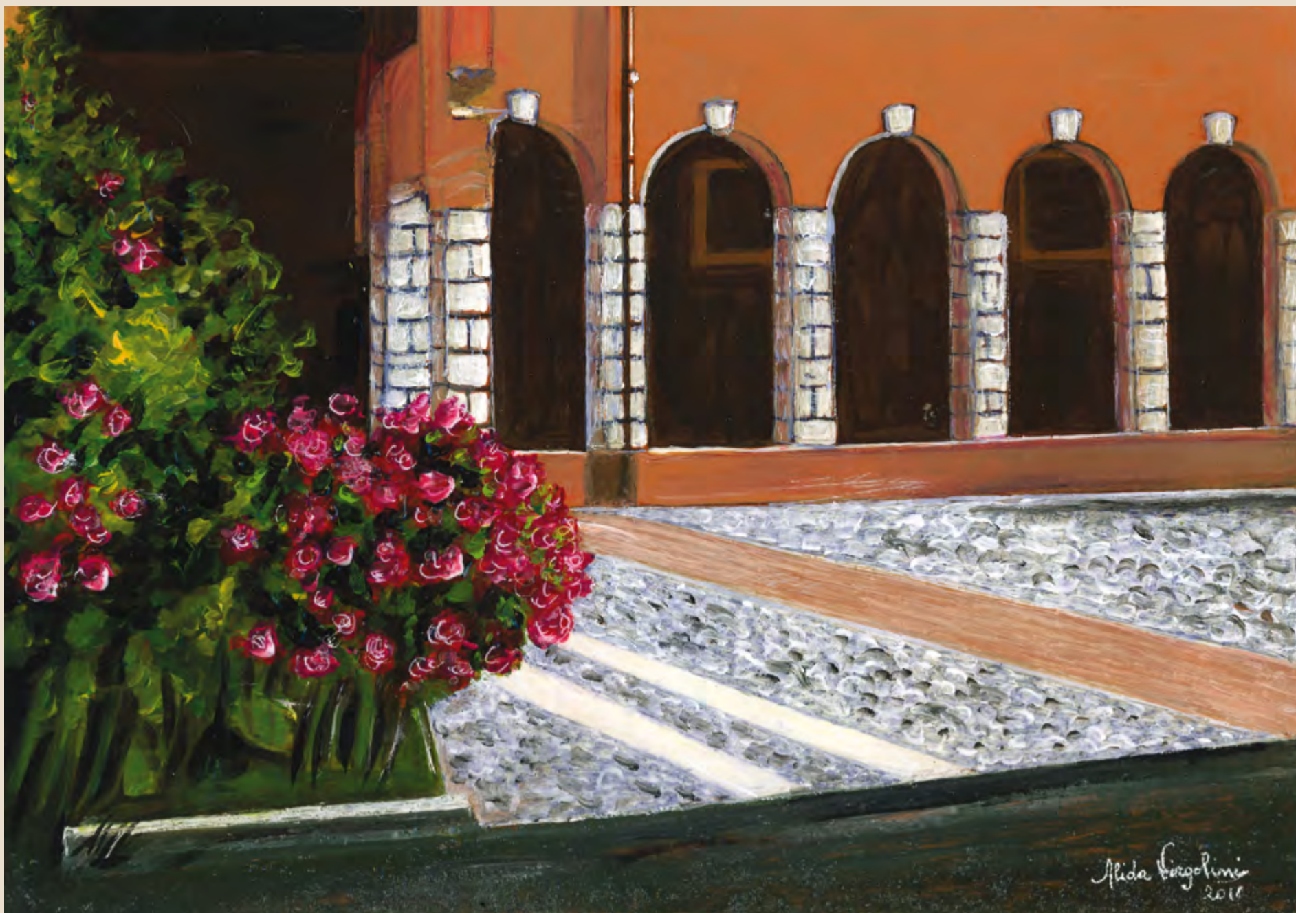
Asaleis in tal convent