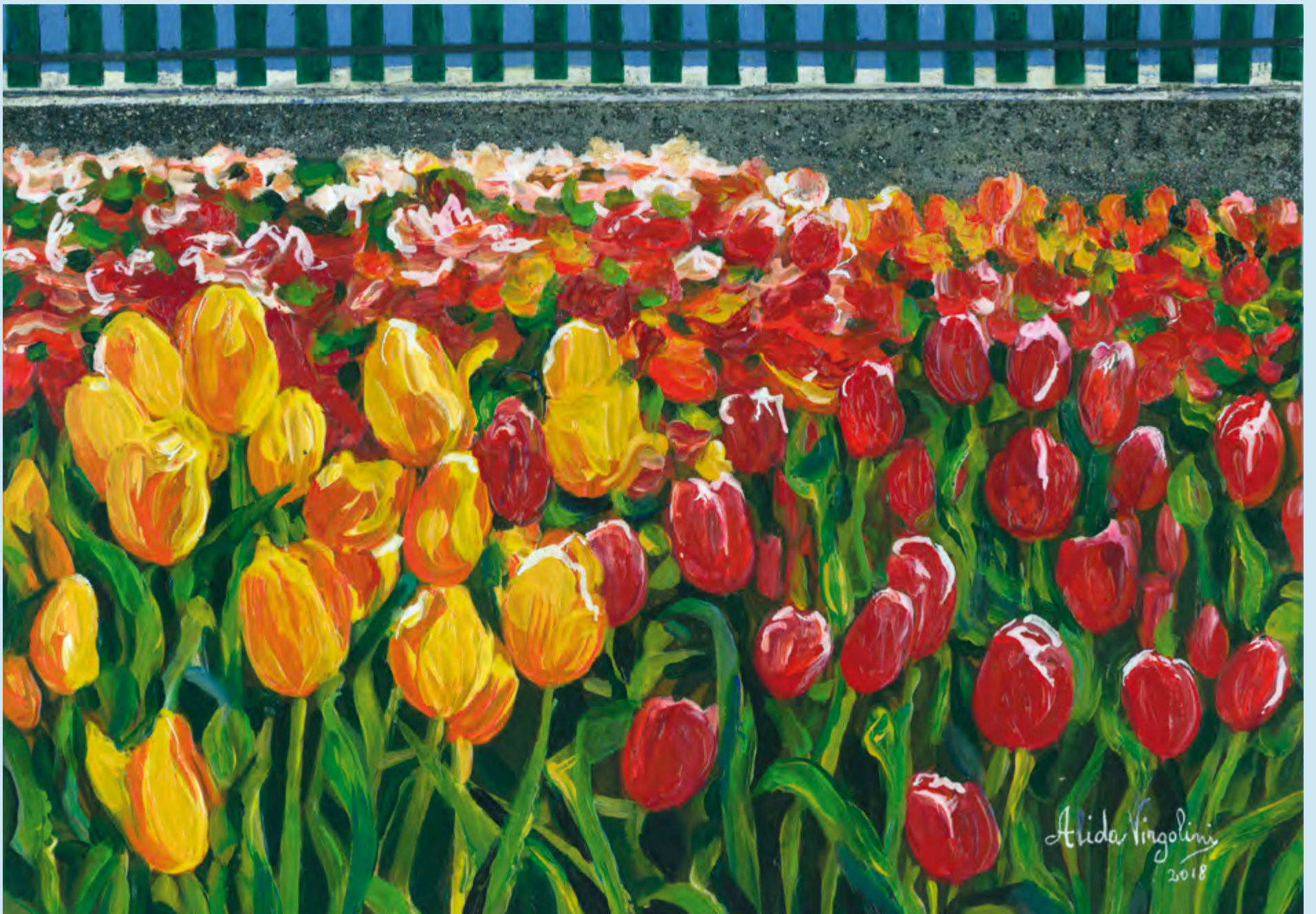
Tulipâns tal 'sardin di Virgolini banda Uànis