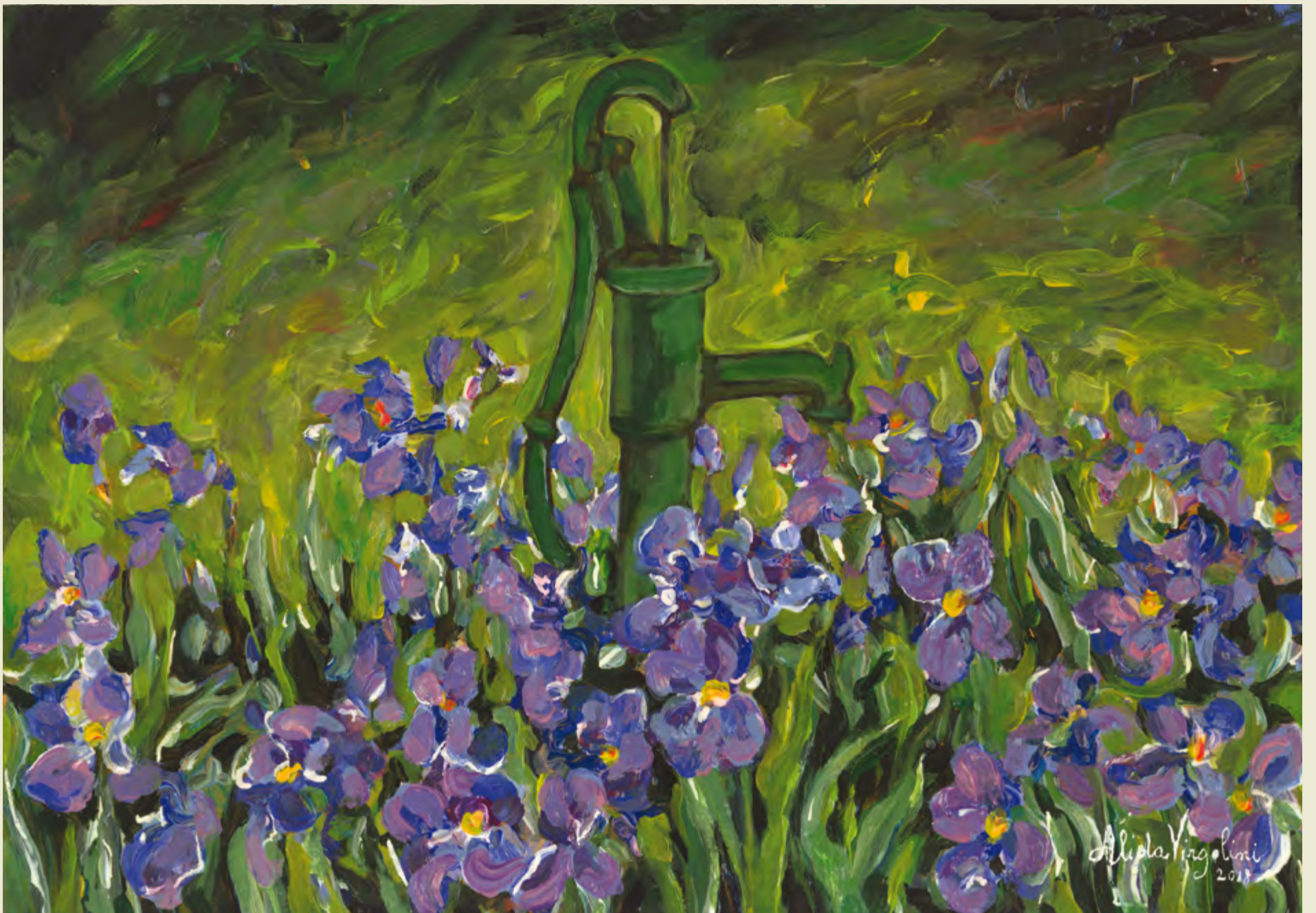
Iris tal 'sardin di Buiat banda Uànis