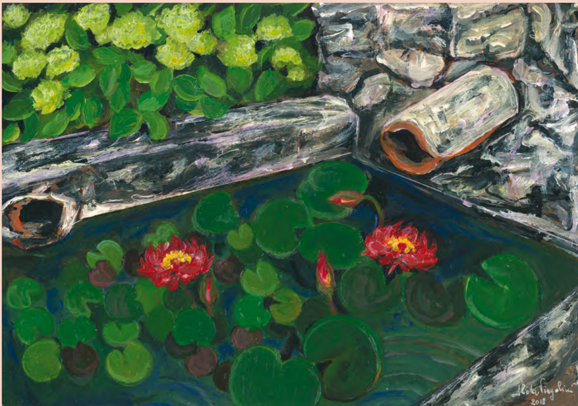
Uànis - Cosaratis tal 'sardin di Bignulin in via De Senibus