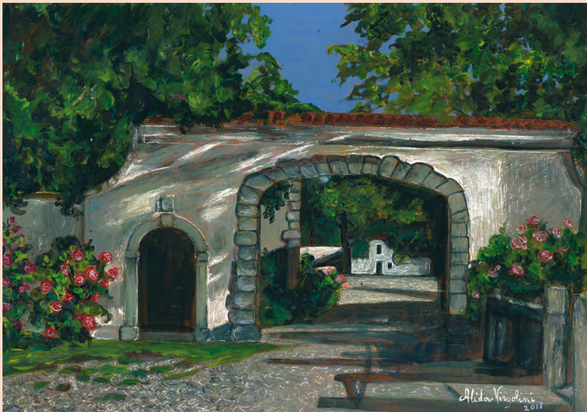
Garofui sul puarton dal Bears da Meridianis