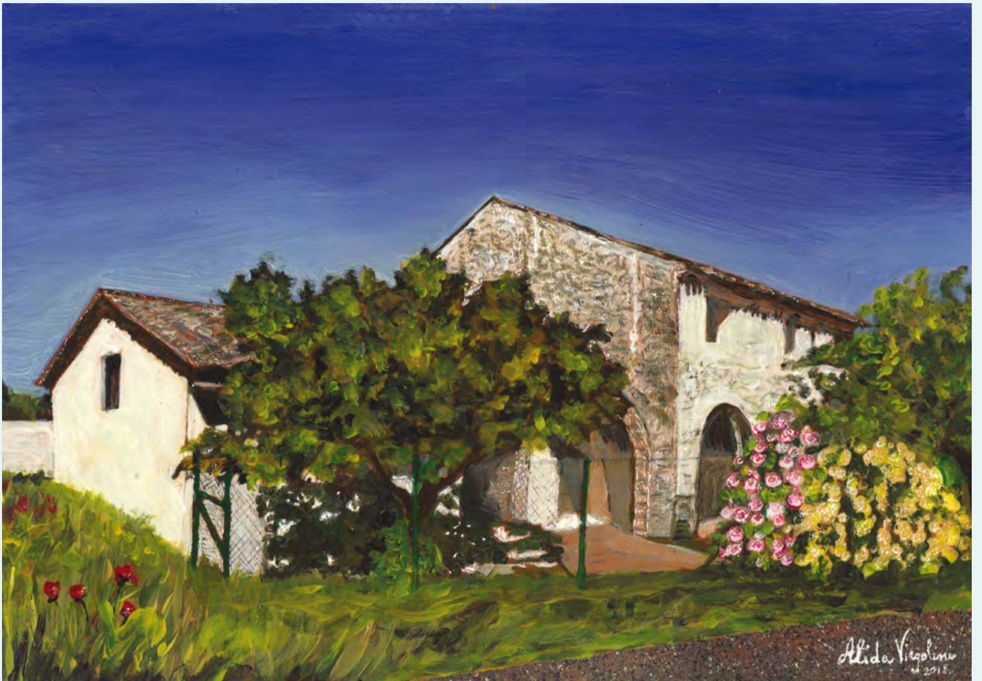
Uànis - Rosis ta Senta