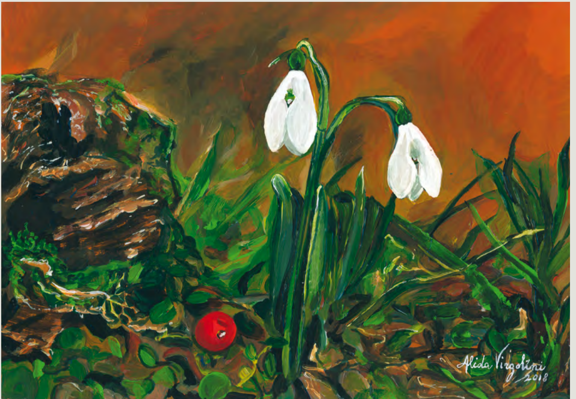
In tal 'sardin di Giaiot in via da barcis