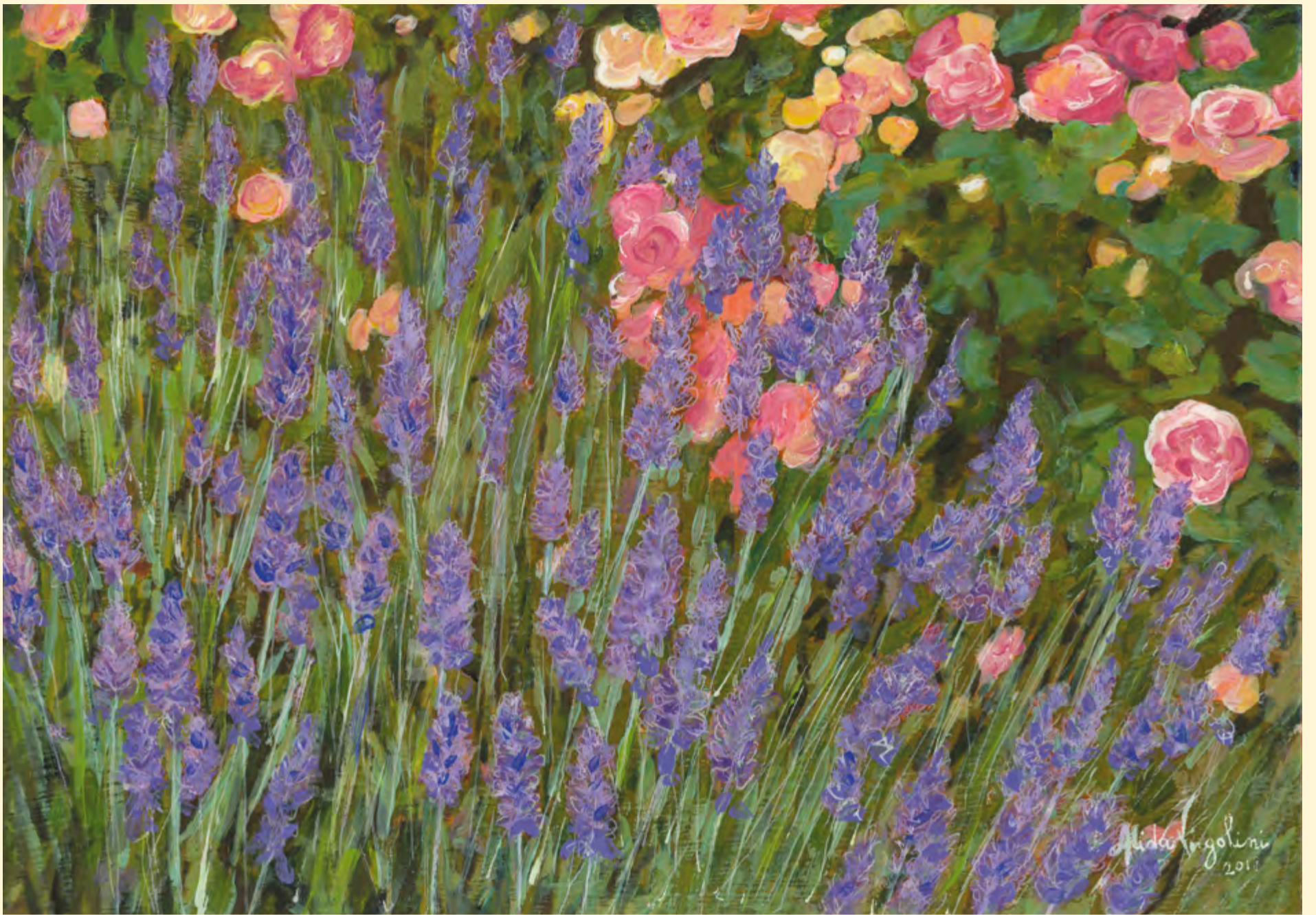
Lavanda tal ciamp di Muciu, banda Craui