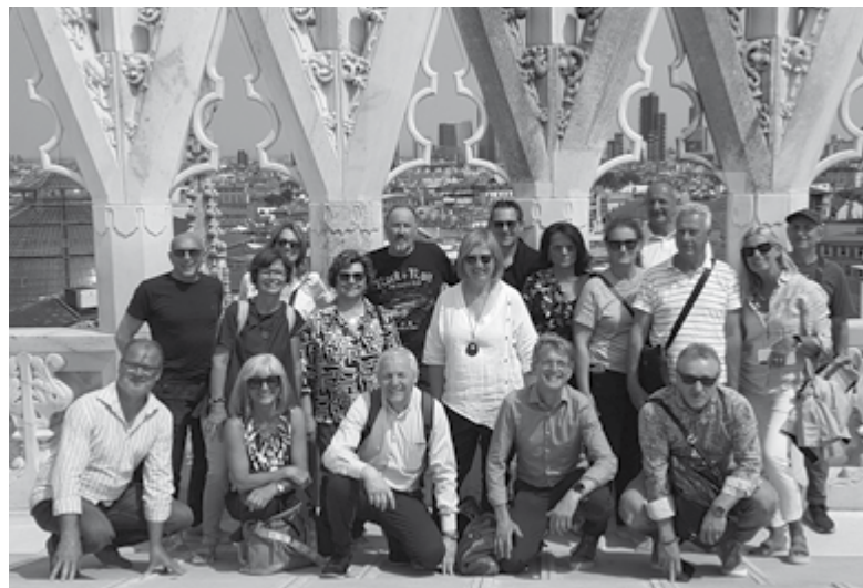
Sulle terrazze del Duomo di Milano.

Il primo giugno, noi sessantenni di Aiello e Joannis, ci siamo ritrovati dopo alcuni anni per trascorrere una giornata assieme e festeggiare il traguardo raggiunto.